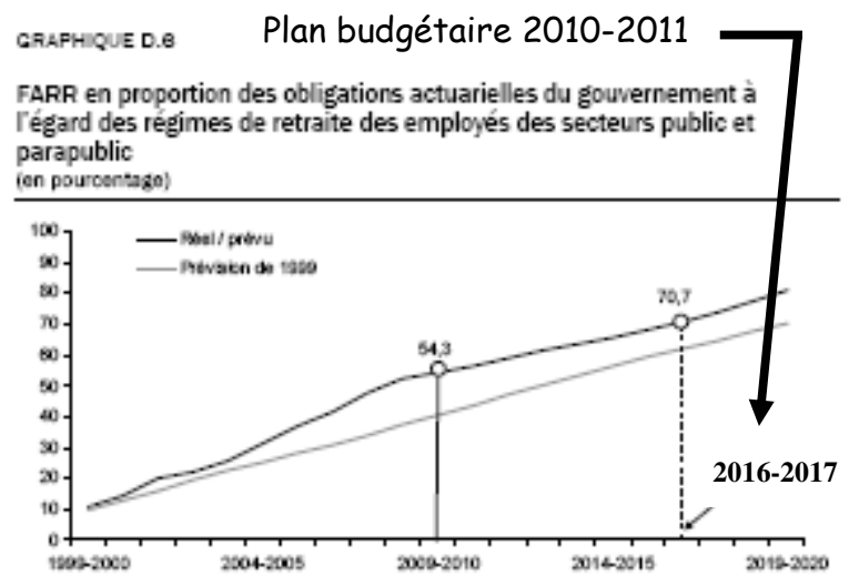
Plan budgétaire 2010-2011, page D-27

Cependant, cette situation nous prouve qu'il est possible de prolonger ce programme de financement du gouvernement comme le RRAME le demande.